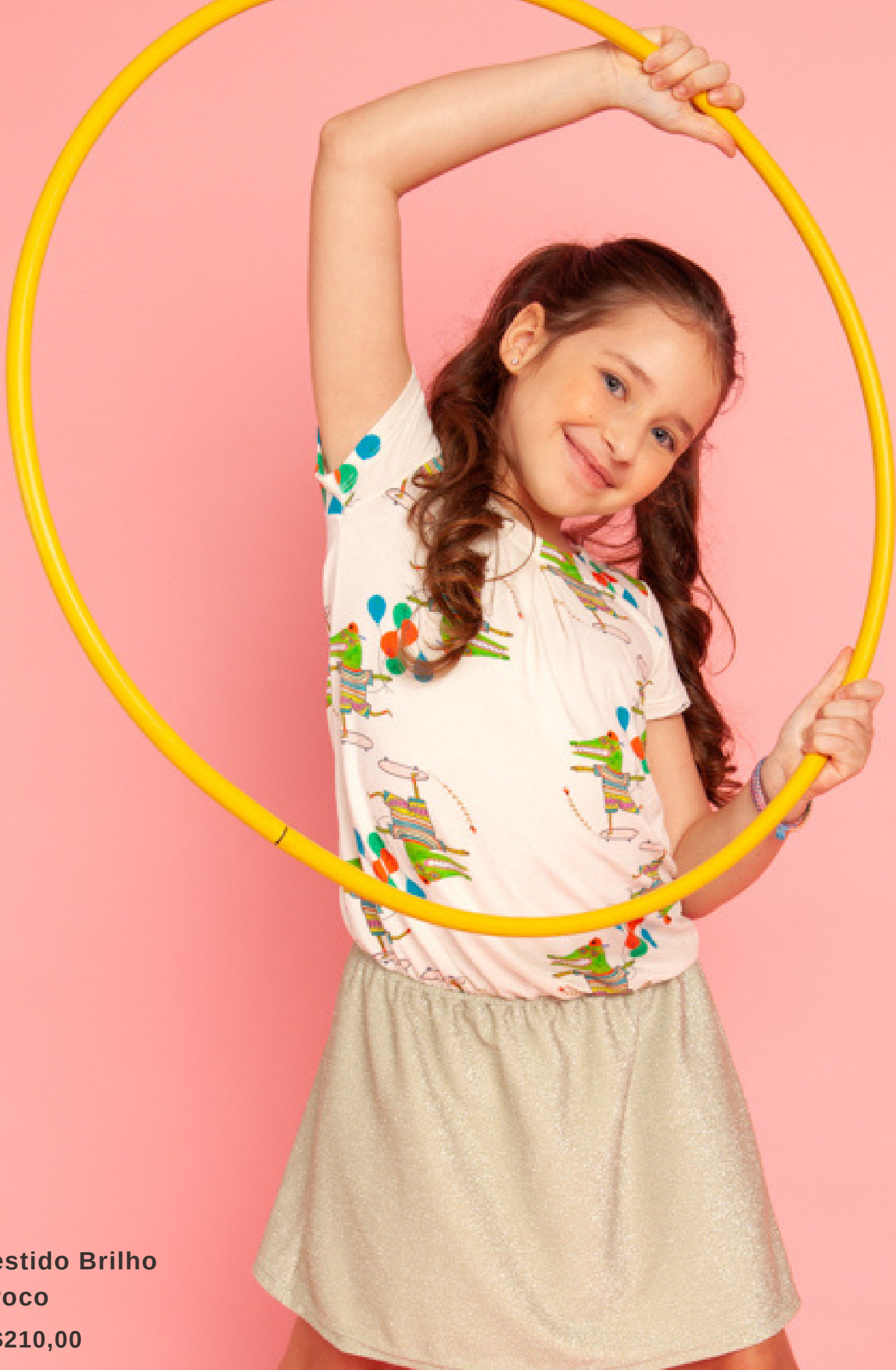
Vestido Brilho Croco R$210,00