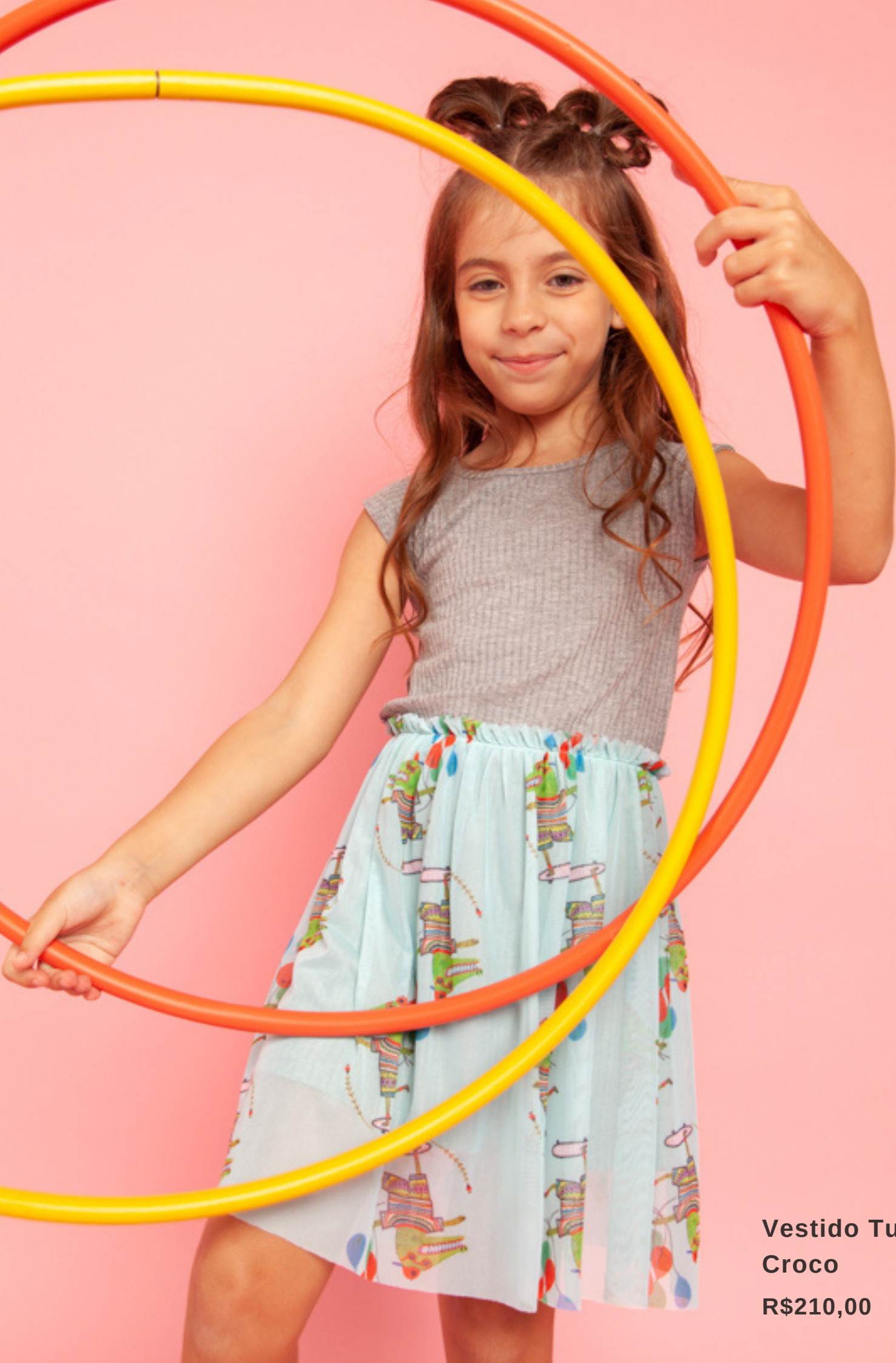
Vestido Tule Croco R$210,00