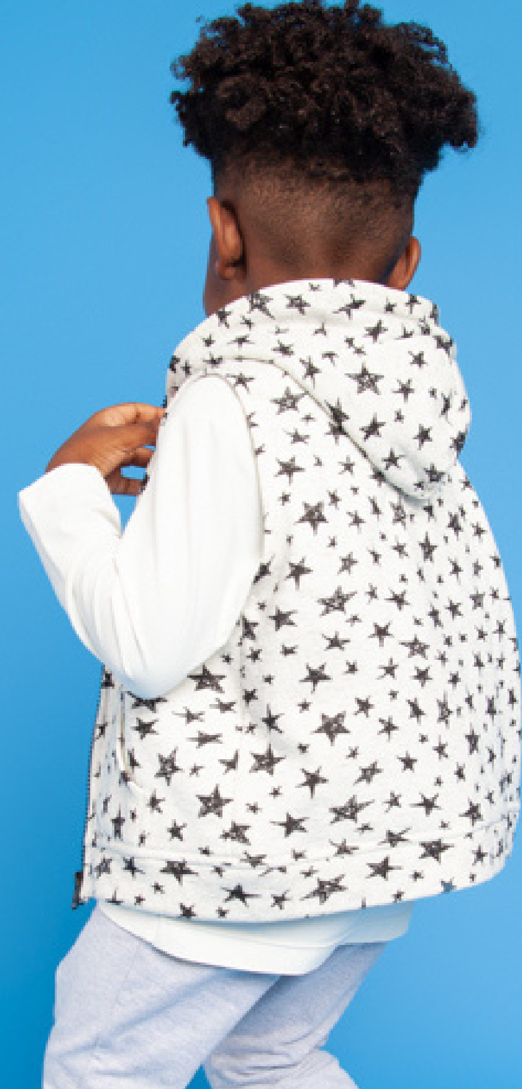
Colete Estrela Menino R$185,00