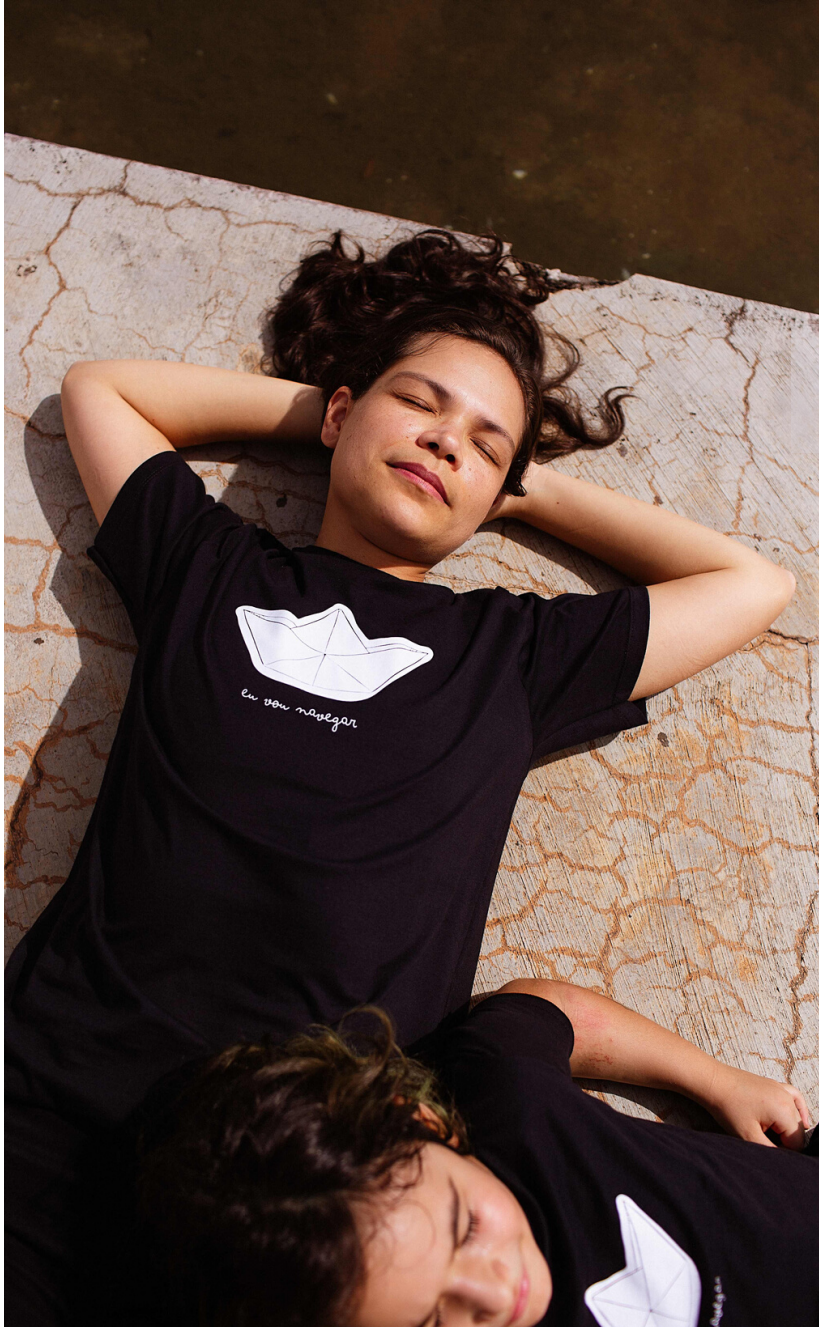
Camiseta preta "Eu vou Navegar"