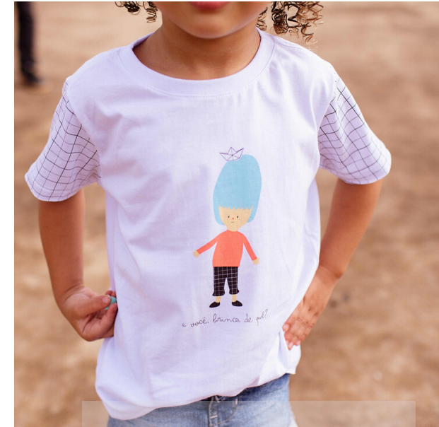
Camiseta "Você Brinca de Quê?"