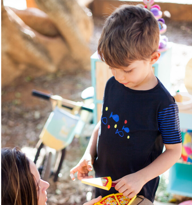
Camiseta "Peixes" infantil