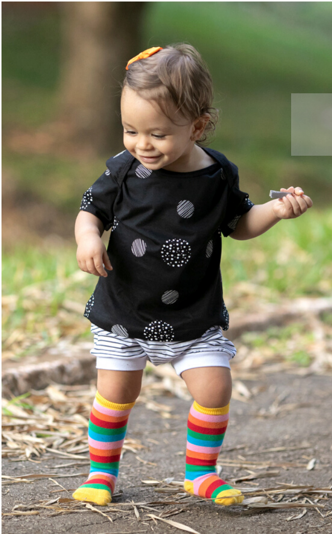
Camiseta preta "Bolas"