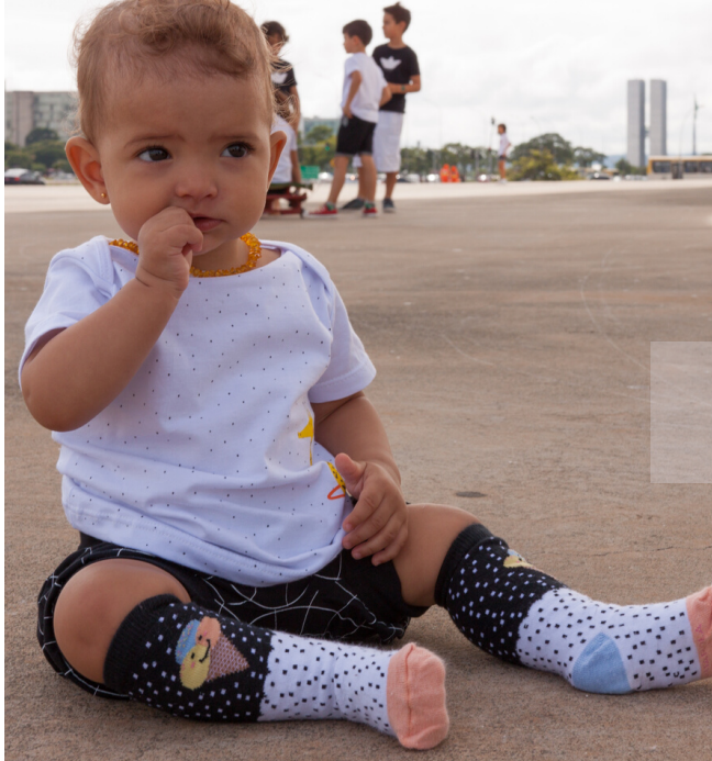
Camiseta "Dona Girafa"