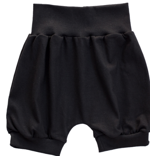
Short preto liso