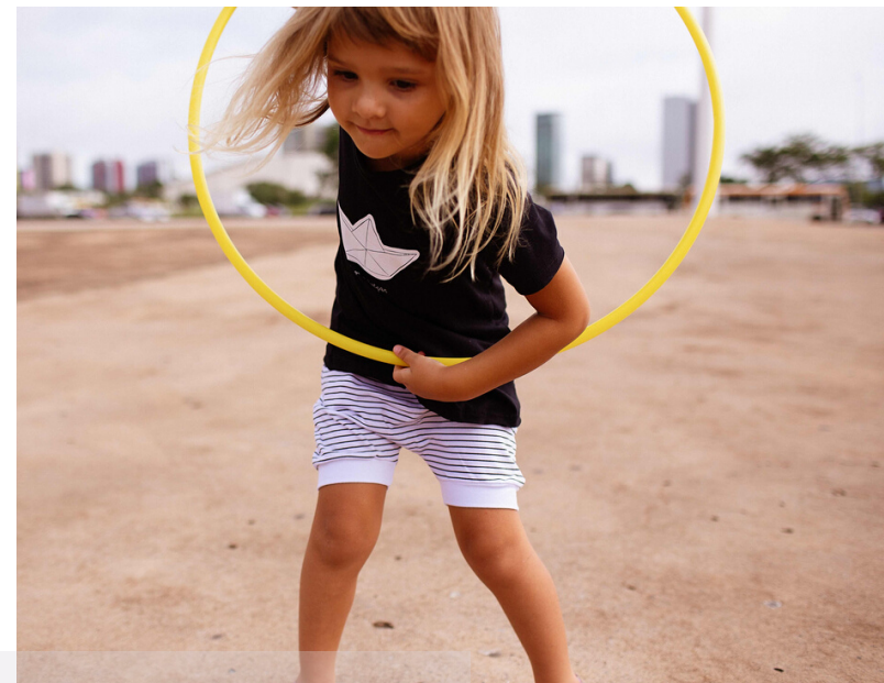
Short branco "Listras"