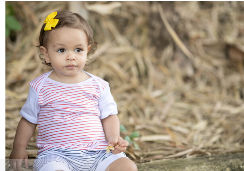
Camiseta "Listras Vermelhas"