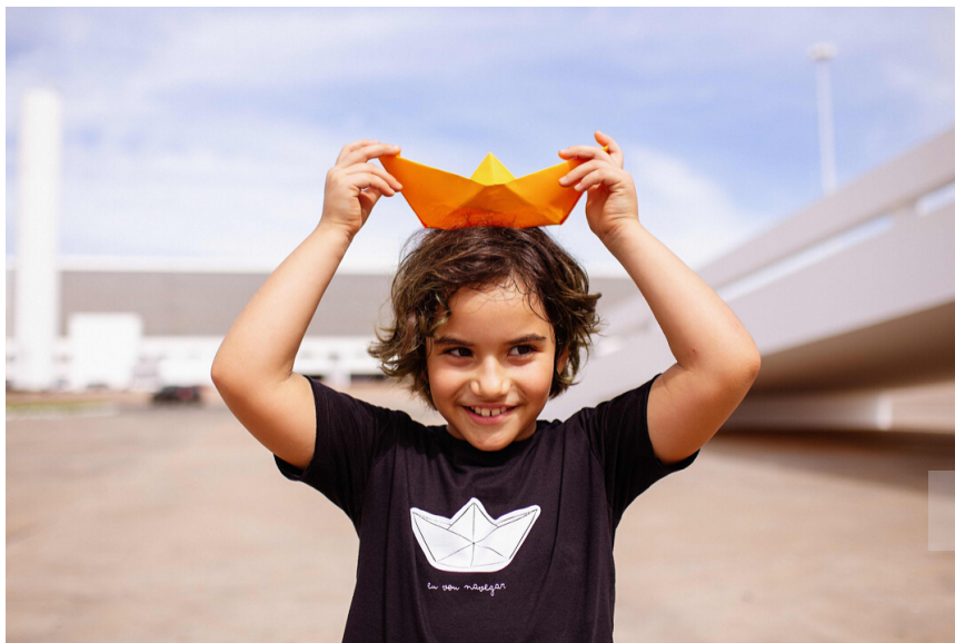
Camiseta "Eu vou Navegar"