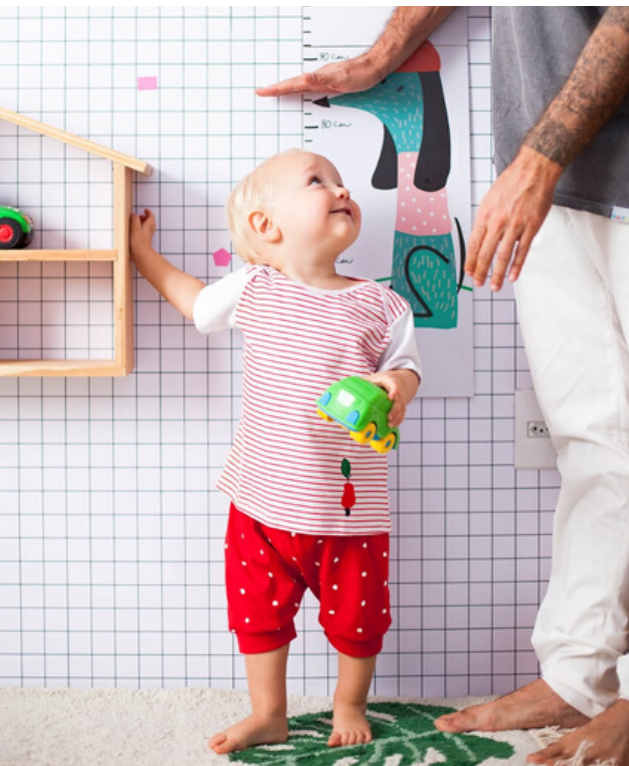
Short vermelho "Poá"