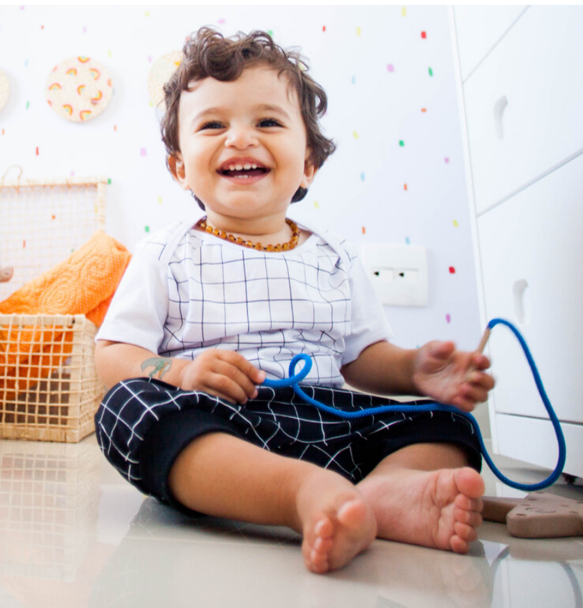
Short preto "Grid"