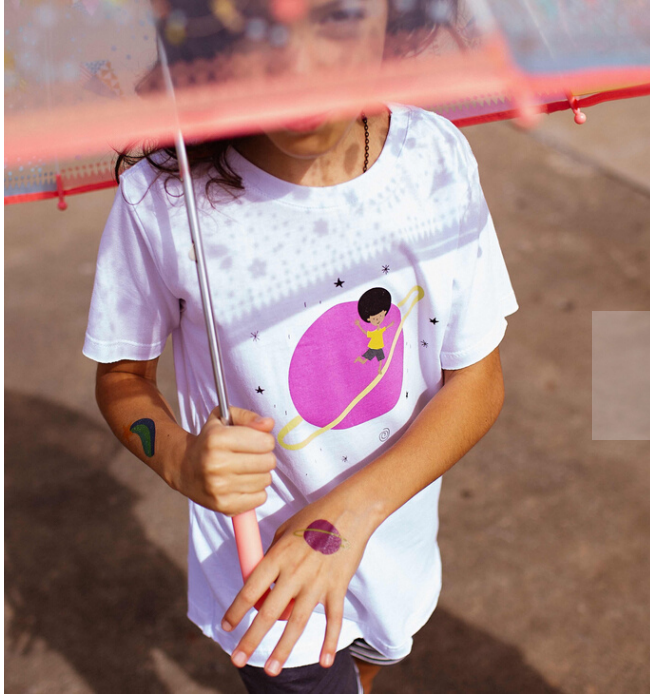
Camiseta "Saturno Play"