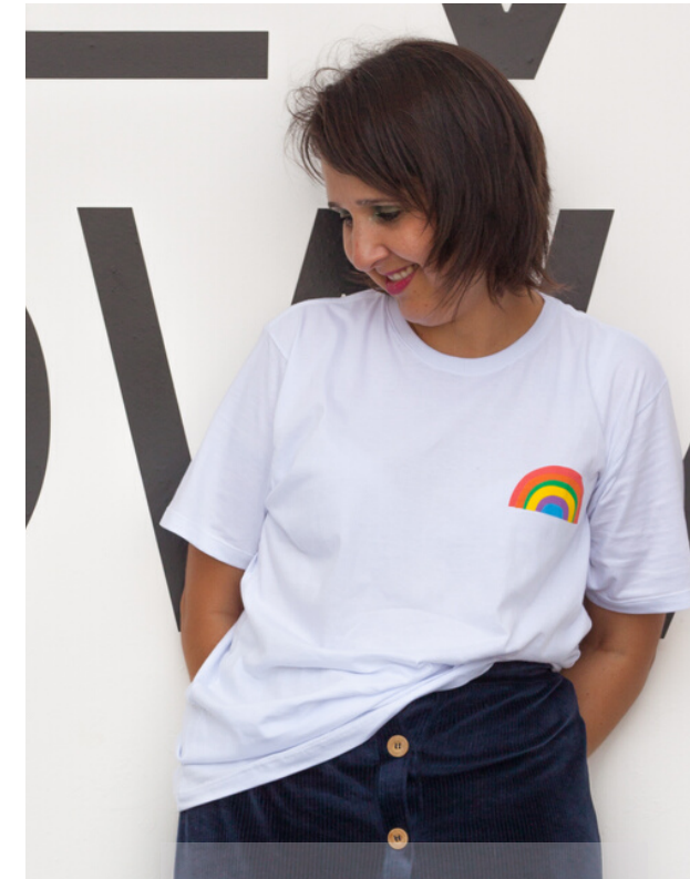
Camiseta branca "Arco-íris"