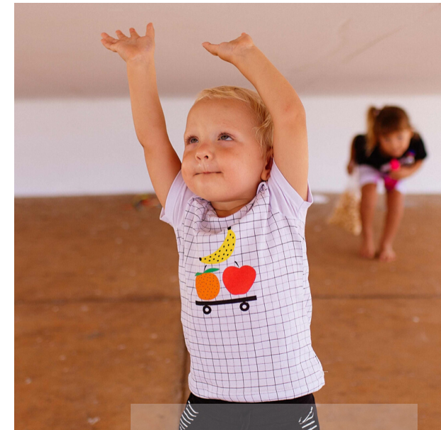
Camiseta "Frutas no Rolê"