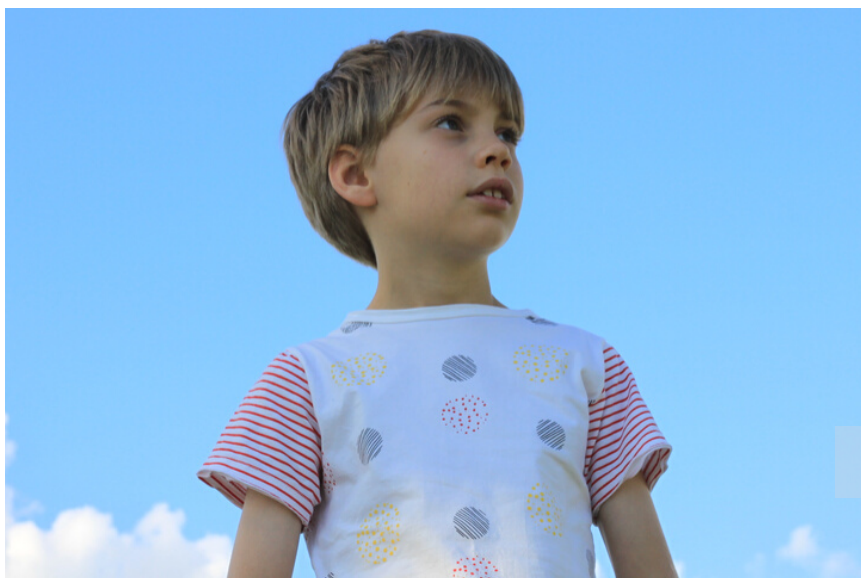
Camiseta "Bolas" champagne