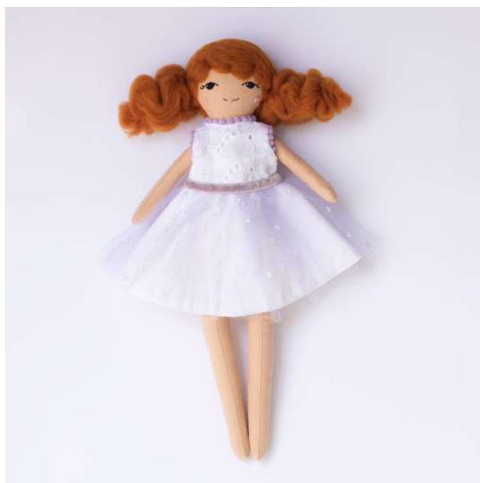
Elsa R$ 240