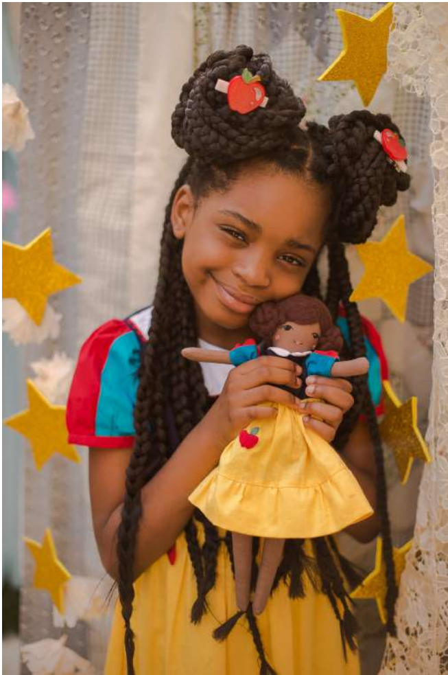
Branca de Neve R$ 240