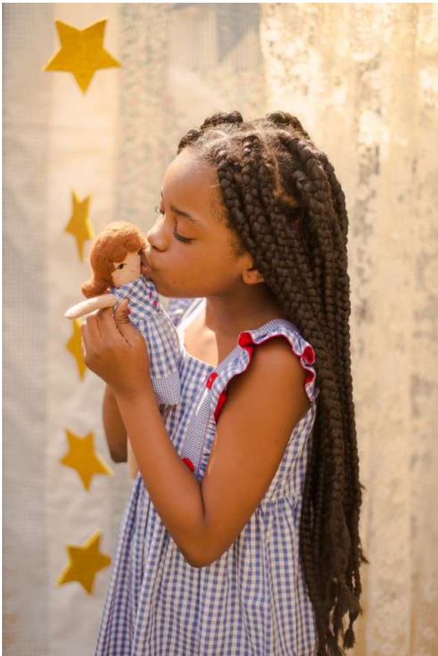
Dorothy R$ 240