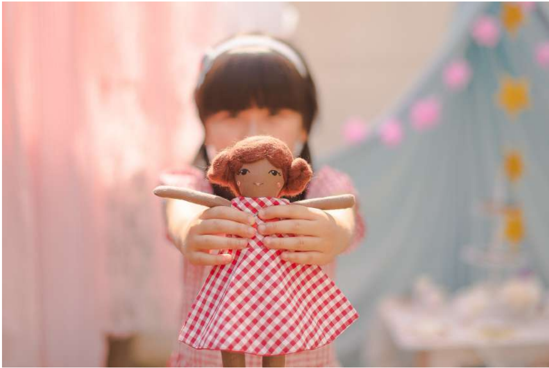
Chapeuzinho R$ 240