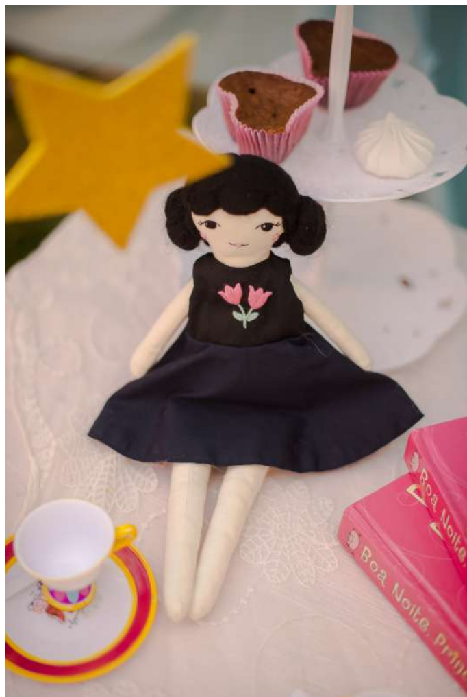
Ana R$ 240